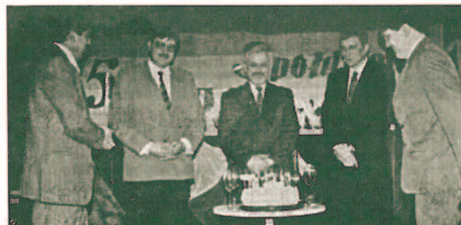
Byłe i aktualne władze spółdzielni przed urodzinowym tortem.