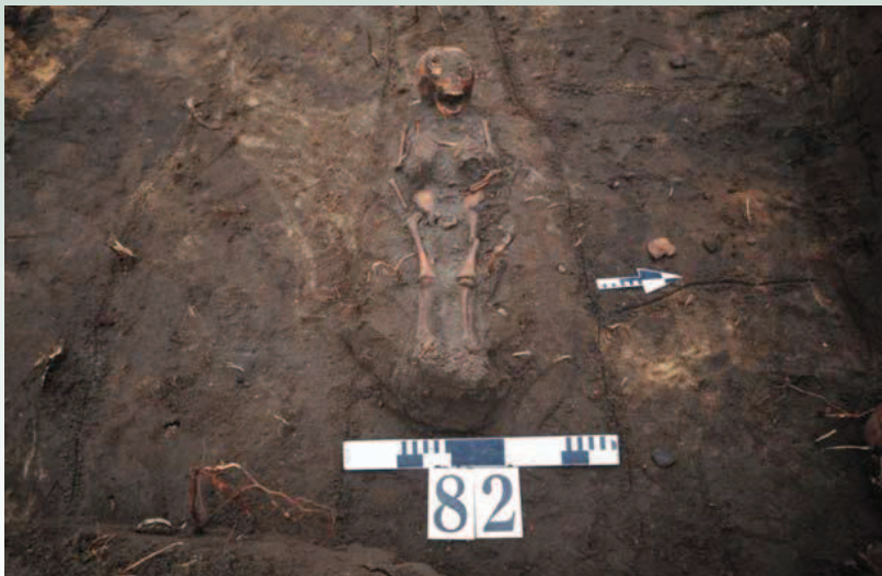
Ryc. 9. Górzycza „Targacz”, grudzień 2009. Pochówek dziecka na cmentarzysku wczesno-średniowiecznym.