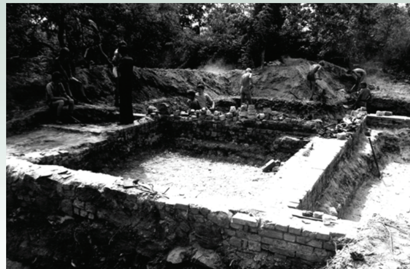
Ryc. 7b. Górzycza „Targacz”, 4 sierpień 1982 r. Wykop nr 6, ujęcie od strony południowej. W pracach wykopaliskowych uczestniczyli mieszkańcy Górzyczy.