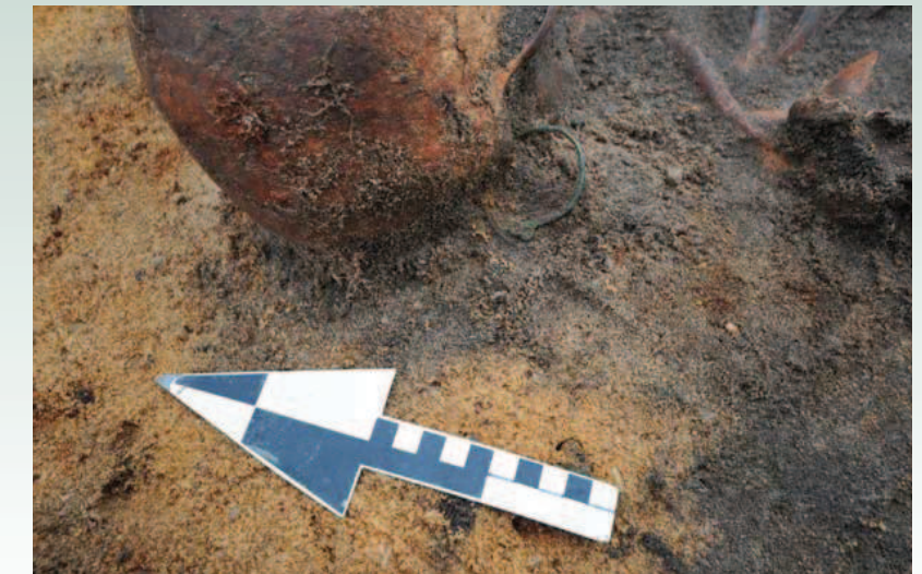
Ryc. 10 a,b. Górzycza „Targacz”, grudzień 2009. Pochówek kobiety z ozdobami głowy, tzw. kabłączkami skroniowymi wykonanymi z brązu.