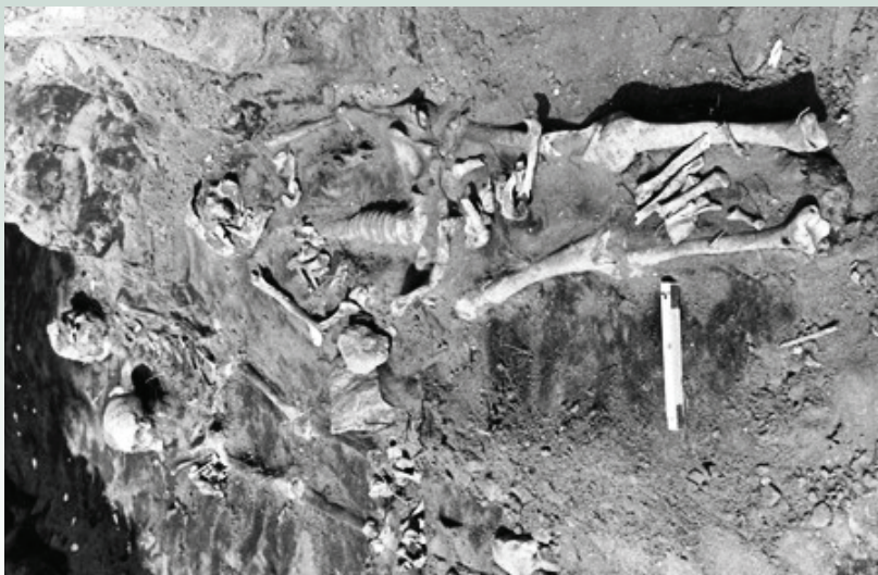
Ryc. 6. Górzycza „Targacz”, sierpień 1980. Pochówki ze średniowiecznego cmentarzyska rządowego, ujęcie od strony wschodniej. W lewym górnym narożniku widoczny prawdopodobnie grób matki z małym dzieckiem.