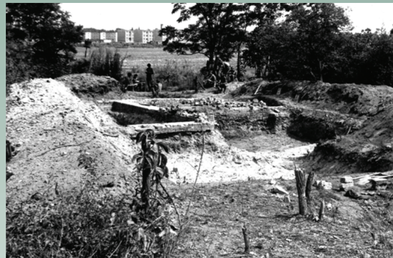
Ryc. 7a. Górzycza „Targacz”, 4 sierpień 1982 r. Ogólny widok fundamentów XIX - wiecznych zabudowań folwarcznych, na podmurówce z cegły gotyckiej.