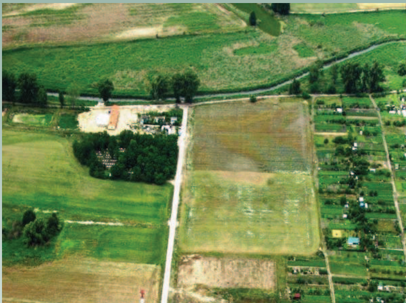
Ryc. 1. Zdjęcie lotnicze przedstawiające tzw. Kępę Targacz. Za nią rozbudowana oczyszczalnia ścieków. Zdjęcie wykonane w ramach projektu: ArchaeoLandscapes Europe.