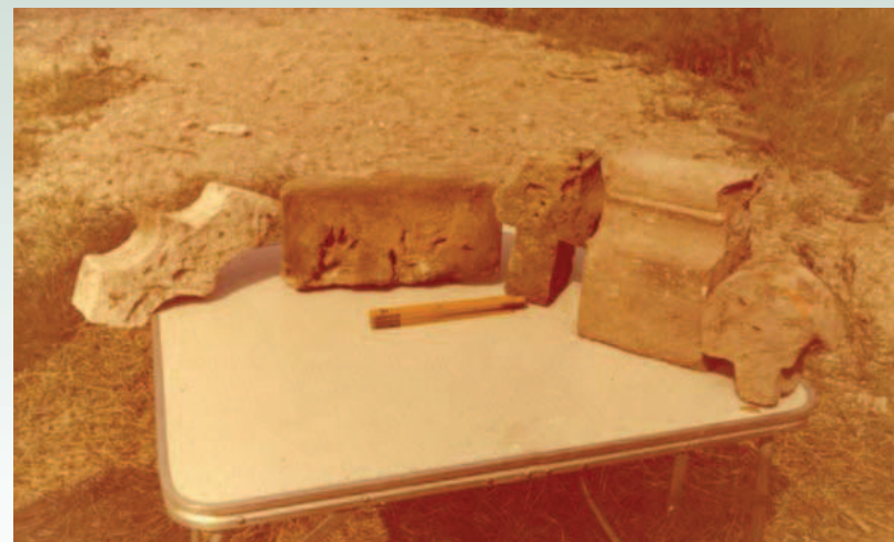
Ryc. 4. Górzycy „Targacz”, sierpień 1980. Kształtki gotyckie wydobyte w trakcie prac archeologicznych.