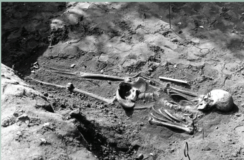
Ryc. 5. Górzycza „Targacz”, sierpień 1980. Średniowieczny grób szkieletowy, ujęcie od strony północno-zachodniej.