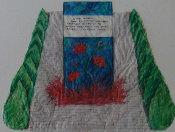
WIDOK OGÓLNY NA OBELISK WRAZ Z ZAGOSPODAROWANIEM TERENU - JESIEŃ